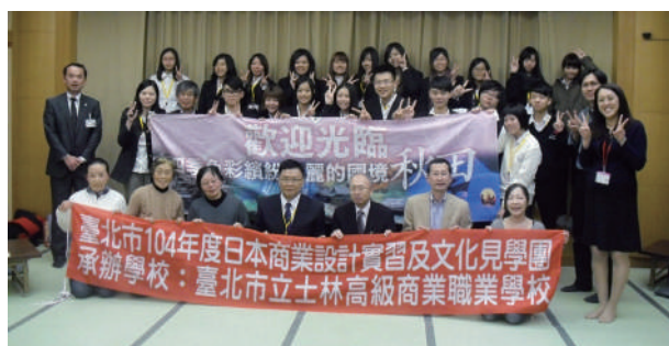
104 年度設計實習團訪問仙北市