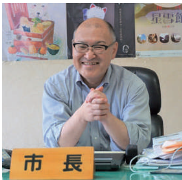
仙北市長 門脇光浩