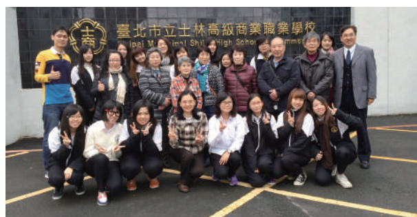
仙北市農家蒞臨士商訪問紀念