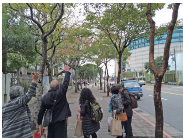
市長蒞臨士林高商訪問紀念

誠摯恭賀台北市立士林高級商業職業學校創立七十週年，衷心獻上祝福。仙北市於2012年開始邀請台灣學校前來參加以仙北市農村區域的農家體驗為核心的教育旅行，以其作為平衡旅遊淡旺季的對策。而第一所前來拜訪此地區的學校便是士林高級商業職業學校。接待貴校後，我們從中體悟到接待國際交流團體的樂趣及重要性，那之後也陸續接待許多國際團體。而現在，我們以身為眾多國外旅客踴躍拜訪的農家體驗地區而聞名，