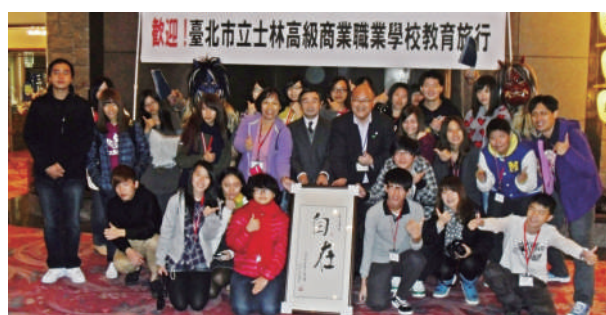
仙北市教育旅行交流紀念

台北市立士林高級商業職業學校 創立 70 周年 誠におめでとうございます。心からお祝いを申し上げます。仙北市では、2012 年から、冬期の誘客対策として台湾からの農山村地域でのホームステイを中心とした教育旅行誘致を開始しましたが、この地域に初めて訪問して下さったのが士林高級商業職業学校でした。貴校の受け入れを行ってから私たちは国際交流団体の受け入れの楽しさや重要性を学び、その後多くの国際団体の受け入れを実施。今では、インバウンドグリーンツーリズムの先進地と呼ばれるまでになりました。