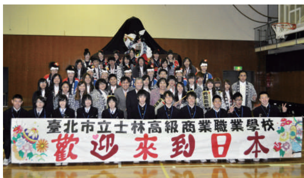
角館高校交流紀念