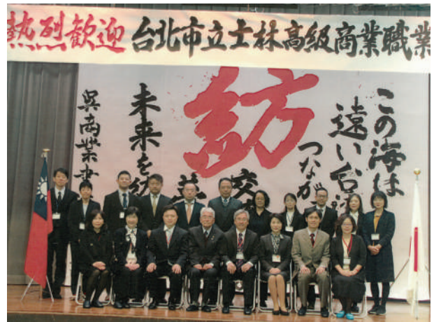
2019年12月士商至吳商交流